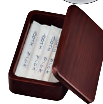
楊枝 > P290参照

19-406-12 (15299) 1,850円 約11×6.5×H3.2cm / 内寸約10×5.3×H2cm ※袋入の楊枝を入れることができます。(最長10cm)